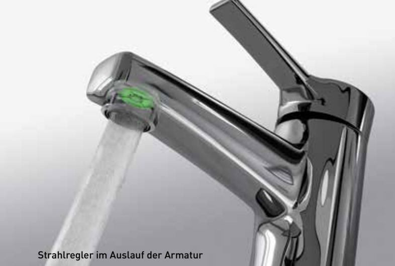
Strahlregler im Auslauf der Armatur

Ob Händewaschen, Duschen oder Geschirrspülen, NEOPERL® Wassersparer reduzieren den Wasserdurchfluss in der Armatur – nahezu unabhängig vom Leitungsdruck. Sie sorgen dafür, dass so viel Wasser wie nötig, aber so wenig wie möglich verbraucht wird. Ein großer Teil dieser Einsparung ist Warmwasser. Dadurch wird bei der Warmwasseraufbereitung Energie gespart – der CO 2 Ausstoß sinkt. Obwohl weniger Wasser fließt, bleibt der Komfort erhalten: Denn dem Wasser wird zusätzlich Luft beigemischt. So ist der Strahl voll, rund, spritzfrei und angenehm.