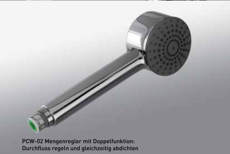
PCW-02 Mengenregler mit Doppelfunktion: Durchfluss regeln und gleichzeitig abdichten